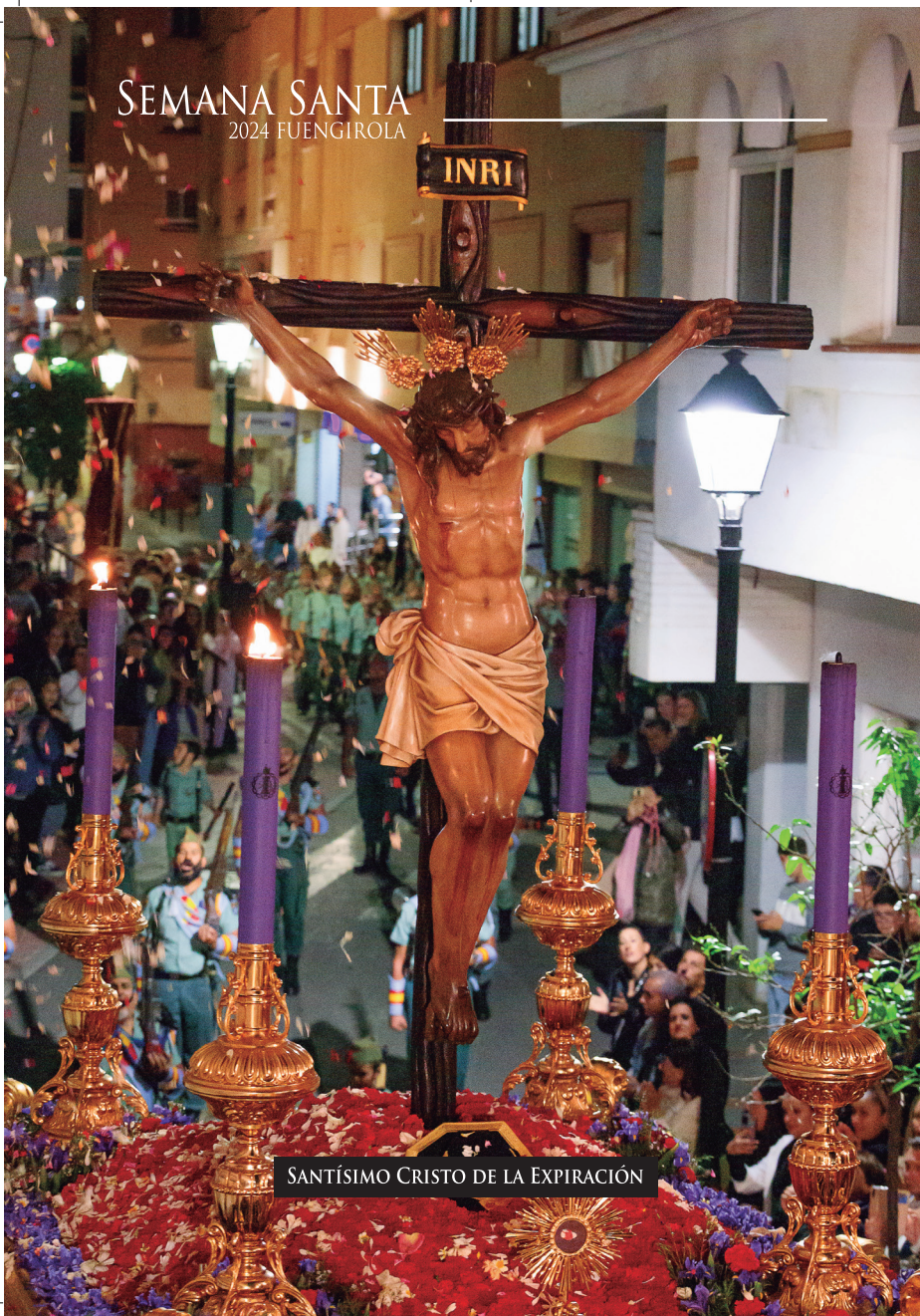
SANTÍSIMO CRISTO DE LA EXPIRACIÓN