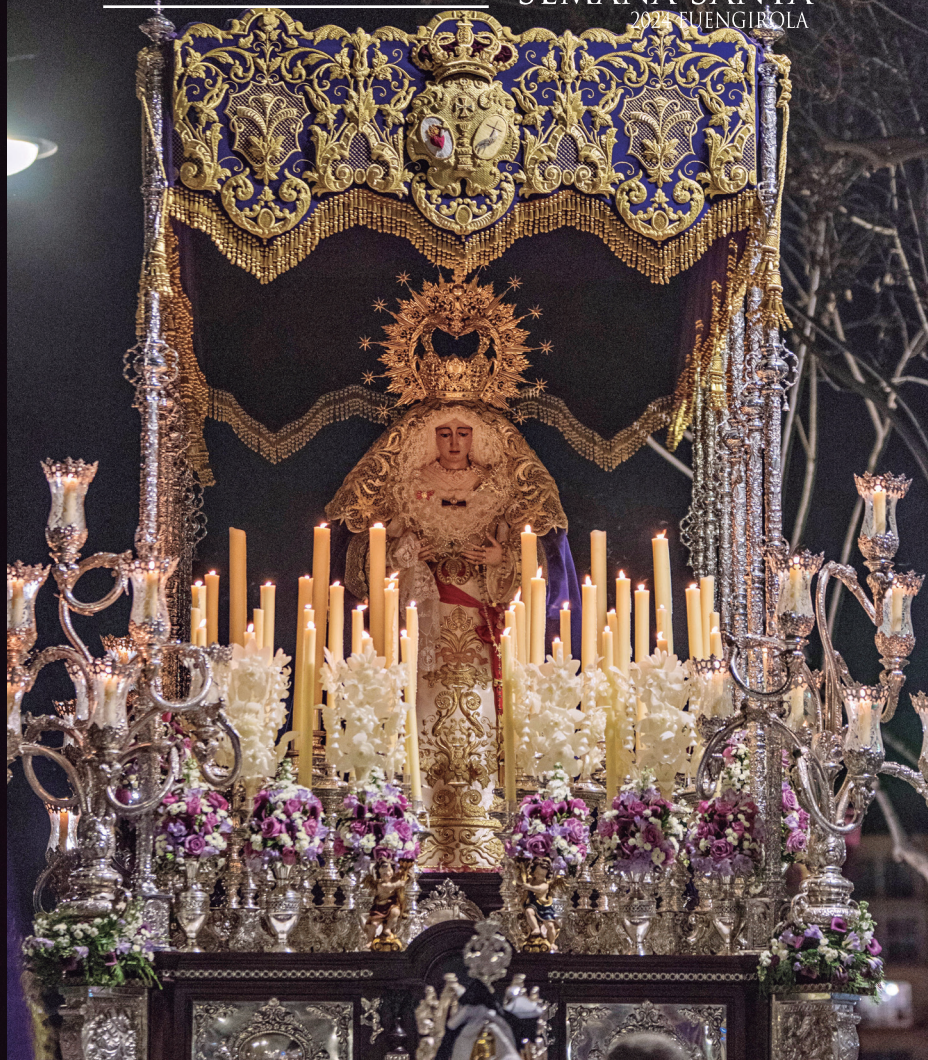
NUESTRA SEÑORA DE LOS DOLORES