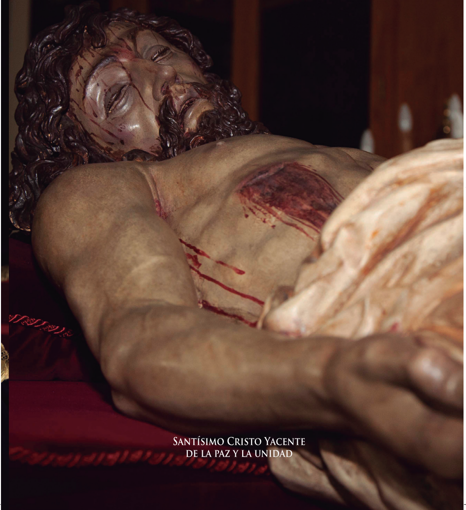
SANTÍSIMO CRISTO YACENTE DE LA PAZ Y LA UNIDAD