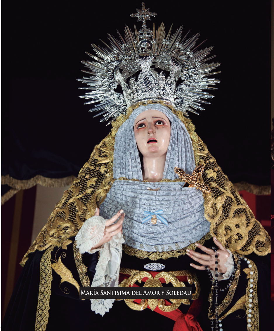
MARÍA SANTÍSIMA DEL AMOR Y SOLEDAD