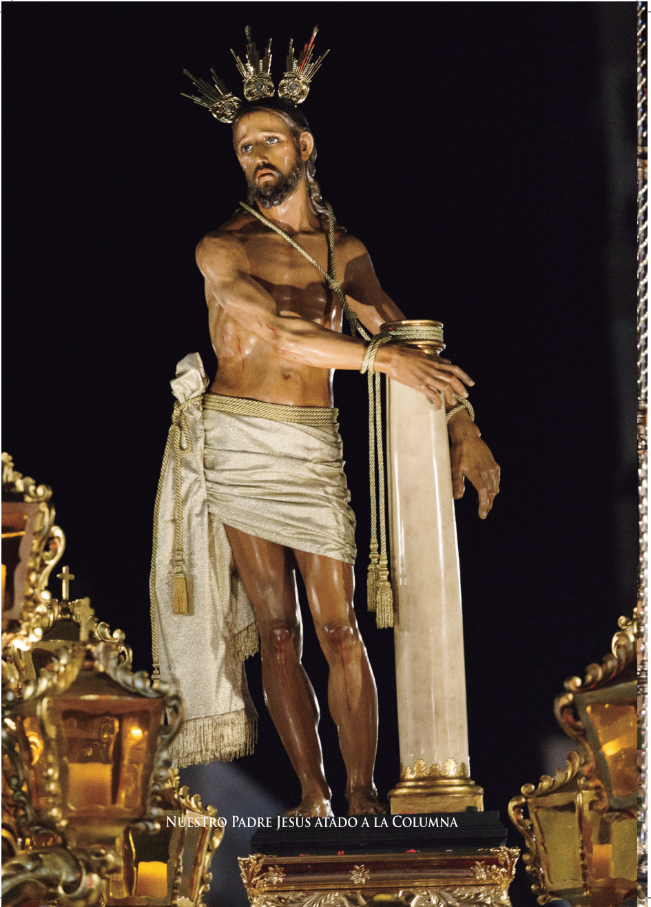
NUESTRO PADRE JESÚS ATADO A LA COLUMNA