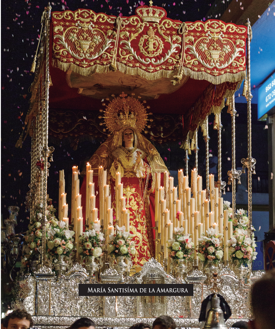
MARÍA SANTÍSIMA DE LA AMARGURA