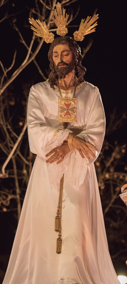
NUESTRO PADRE JESÚS CAUTIVO