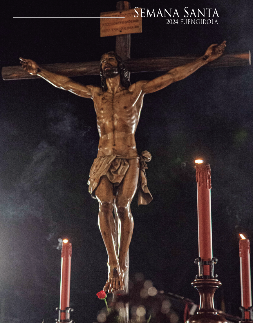
SANTÍSIMO CRISTO DE LA CARIDAD